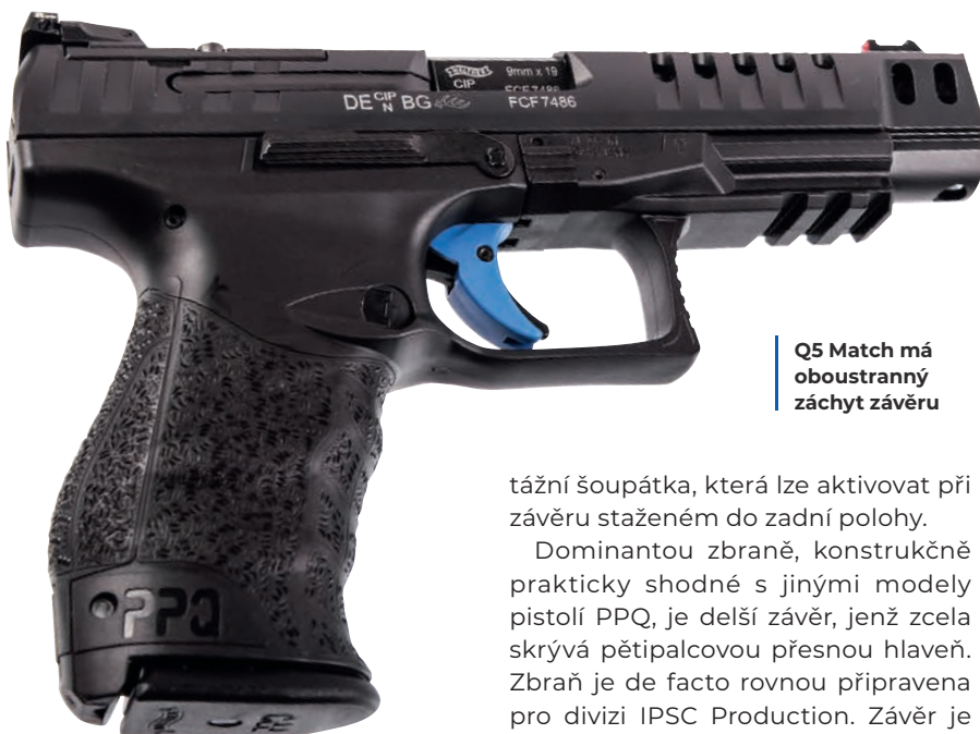
Q5 Match má oboustranný záhyt závěru

Závěr a hlaveň PPQ Q5 Match jsou samozřejmě ocelové. V rámu najdeme šachtu na dvouřadový zásobník z ocelového plechu s jednořadým vyústěním. Vratná pružina je z plochého drátu a je v nerozebíratelné sestavě s vodičí tyčkou; při montáži zbraně se jednoduše zaklesne mezi hlavňovou kulisu a čelo závěru. Pistole má oboustranné ovládání, vlastně jen střelecké pohotovosti na obou stranách rámu, protože tlačítko záhytu zásobníku u kořene lučičku lze přestavět pro praváky i leváky a jiné ovládací prvky zbraň nemá. Na rámu se nacházejí svislá demon-