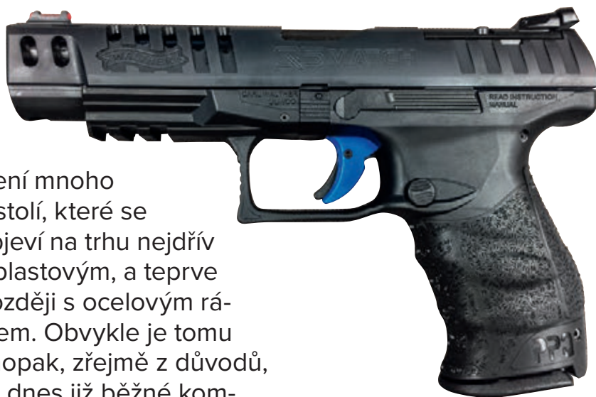
Walther PPQ Q5 Match na polymerovém rámu

Společnost Carl Walther GmbH Sportwaffen z německého Ulmu se se svým modelem PPQ Q5 Match vydala opač-