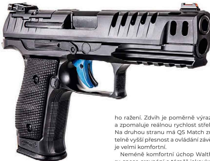
Walther PPQ Q5 Match SF má ocelový rám

žádné match grade – se lze na 25 metrů dostat i k rozptylu pěti ran pod 50 nebo dokonce pod 40 mm (například Sellier & Bellot FMJ 115 grs – 38 mm). Případně přebíjené náboje vyladěné pro tuto konkrétní zbraň by mohly mít potenciál ještě lepší přesnosti. Střelba z Q5 je absolutní radost. Sice svým chováním není až tolik vzdálena semikompaktním PPQ, které se mohou zdát trochu nervózní, celkový dojem je ale velmi dobrý.