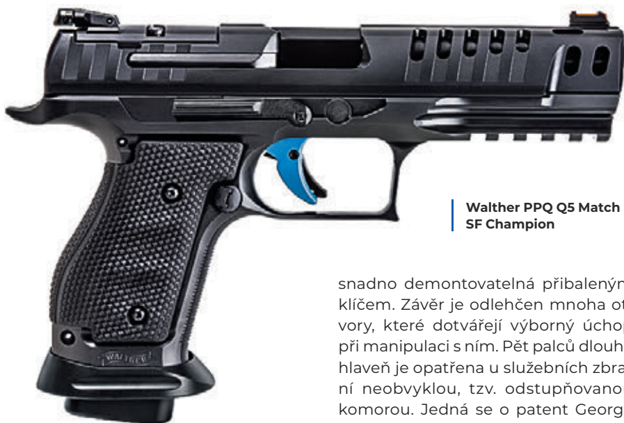
Walther PPQ Q5 Match SF Champion

Maloobchodní cena Q5 Match SF pro americký trh tak byla zatím stanovena na 1499 USD, v domovské Spolkové republice dokonce 1699 eur a 1898 eur pro verzi Q5 Match SF Champion. □