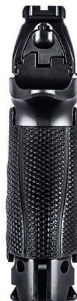
I pistole s ocelovým rámem má výměnné střenky se hřbetem rukojeti

rámu, je horká novinka. Motivací pro její vznik bylo pravděpodobně vyloučení poněkud negativní a u soutěžní zbraně velmi sledované vlastnosti: vyššího zdvihu ústí hlavně po výstřelu. To várná, vědoma si limitů polymerových rámu, tedy připravila rám ocelový. Výroba ocelového rámu třískovým obráběním je o hodně pracnější a dražší než u polymerového. U polymerových rámu jsou sice ze začátku drahé formy, ale pak jde rámy doslova bouchat jak Baťa cvičky . Ale výrobce evidentně věří, že zvýšené náklady na PPQ Q5 Match SF se mu vrátí.