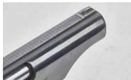
Na svrchní straně závěru je vyfrézována lišta se zdrsňným povrchem kvůli potlačení odlesků; muška je integrální součástí závěru

uplatnila zbrojovka Walther celkem 6 patentů, z nichž některé našly uplatnění i na následujících modelech (například sklopný lučik jako prostředek pro rozebírání zbraně).