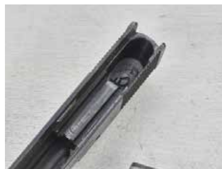
Úderník je uložen pod krytkou, jež je fixována šroubem. Pro běžnou údržbu se nevyjímá