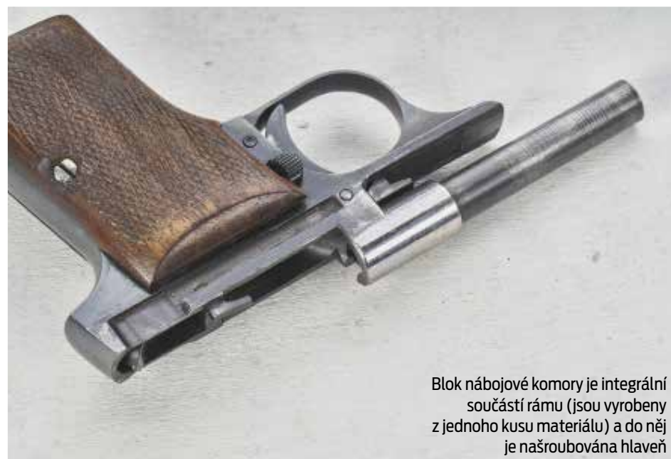
Blok nábojové komory je integrální součástí rámu (jsou vyrobeny z jednoho kusu materiálu) a do něj je našroubována hlaveň