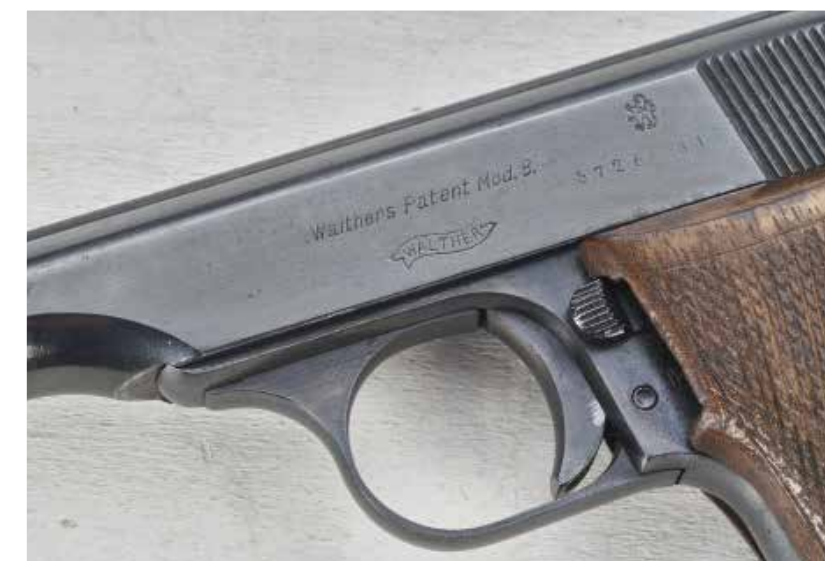
Dole: Originální signování výrobce bylo necitelně doplněno o československé zkušební značky. Pistole tím samozřejmě ztrácí na hodnotě

► Modell 8 je i z dnešního pohledu vzhledově vydařená , elegantní a kompaktní pistole, zatímco model 7 nese ještě stopy designu z přelomu století.