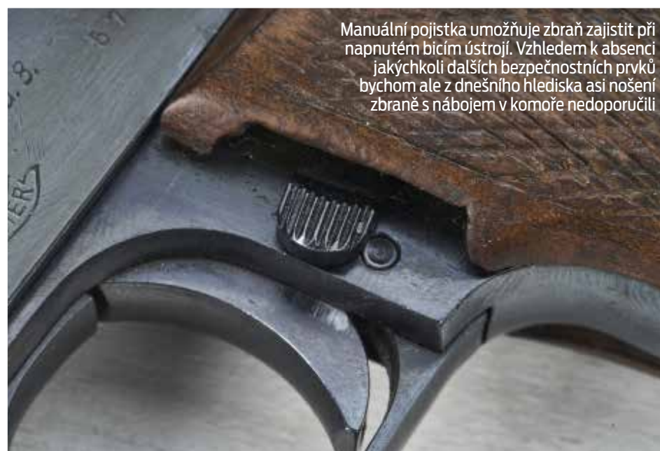
Manuální pojistka umožňuje zbraň zajistit při napnutém bicím ústrojí. Vzhledem k absenci jakýchkoli dalších bezpečnostních prvků bychom ale z dnešního hlediska asi nošení zbraně s nábojem v komoře nedoporučili

uplatnila zbrojovka Walther celkem 6 patentů, z nichž některé našly uplatnění i na následujících modelech (například sklopný lučik jako prostředek pro rozebírání zbraně).