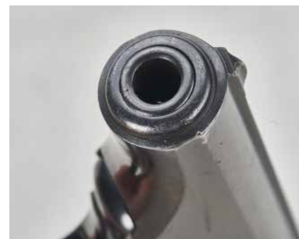
Elegantní tvar přední části pistole je jasnou předpovědí designu budoucích pistolí Walther