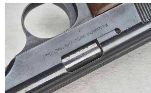
Vlevo: Vytahovač u druhého a třetího výrobního provedení je již klasický externí. U prvního provedení byl vytahovač vnitřní