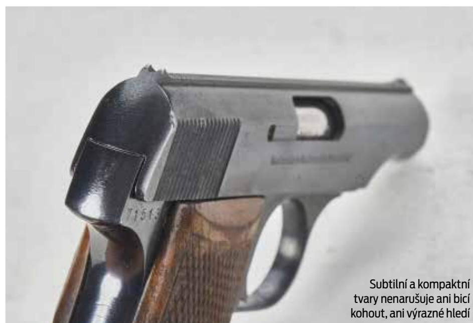
Subtilní a kompaktní tvary nenarušuje ani bicí kohout, ani výrazné hledí